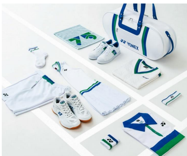
(上) 75周年記念モデルはシューズからバッグまで幅広く展開 (下) 今大会で選手が着用する主な75周年記念モデルウェア

高品質のシャトルcock「Tournament」をはじめとしてコートマットの提供や、高い技術を持つ「ヨネックスストリングングチーム」のサービスを通じて1984年から同大会をサポートしています。